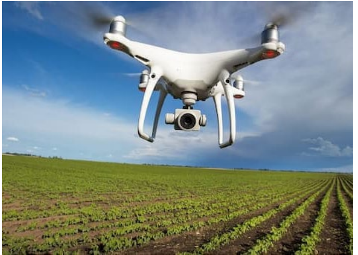
Drones para agricultura familiar são aposta da Embrapa — Foto: Reprodução.

Segundo o pesquisador, o uso de drones é fundamental ainda na otimização do planejamento de rotas de cobertura para controle biológico, como a identificação da área de cobertura, determinação de distâncias, tipo de aplicação do agente biológico em uso e altitude de voo. Experimentos iniciais com o uso da tecnologia constataram redução no tempo de planejamento comparado aos planos gerados manualmente por um profissional, além da diminuição das possibilidades de erro humano, graças à automatização.