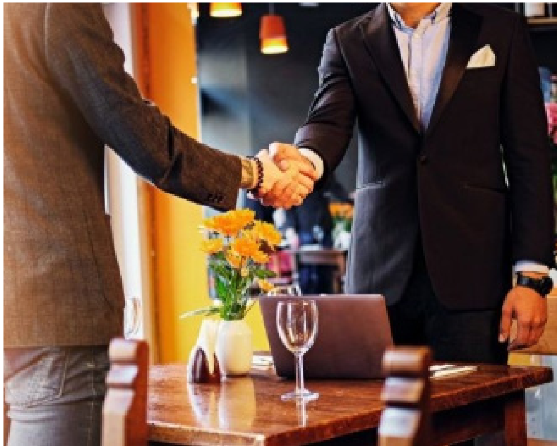
Eis o essencial: é fundamental sorrir e olhar a pessoa nos olhos

É no primeiro encontro que se iniciam os contatos sociais e profissionais. Importante agir com naturalidade, além de dominar as regras de etiqueta e precedência para não quebrar a hierarquia. Há uma regra básica para todos os tipos de apresentação. Quem quer que esteja se apresentando ou sendo apresentado, deve sorrir e olhar a pessoa nos olhos, seriedade e tensão não funcionam bem nas apresentações.