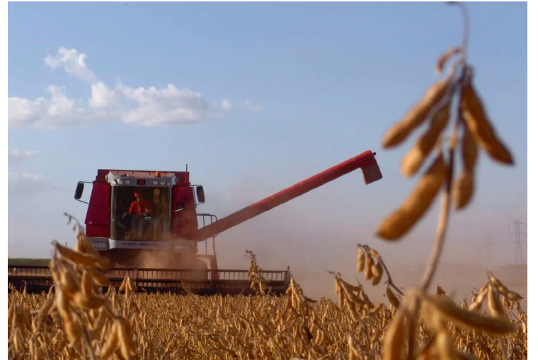
Estima-se que aproximadamente 33 mil produtores rurais no estado serão impactados por essa nova medida

A partir de agosto, aqueles que não estiverem em conformidade com a exigência do DTE ficarão em situação de precariedade perante as suas obrigações acessórias.