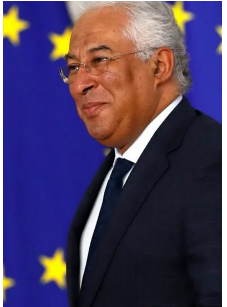
Tensão: António Costa causa mal-estar no Velho Mundo após declarações controversas

Nos últimos anos, houve um renovado interesse pelo patrimônio e identidade judaica na Europa, exemplificado por iniciativas como a lei de cidadania sefardita de Portugal. No entanto, esses desenvolvimentos positivos são frequentemente ofuscados por incidentes antissemitas persistentes e tensões políticas.