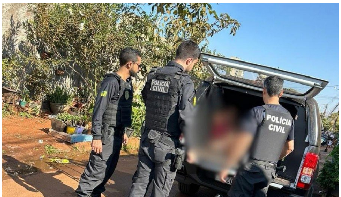
Operação Rota 110: mandados foram cumpridos na manhã desta terça-feira, 9, em Rio Verde

No momento das diligências foi dado cumprimento ao referido mandado de prisão, bem como lavrado contra ela Auto de Prisão em Flagrante. Várias porções de droga foram encontradas na casa, muitas delas fragmentadas (pedras de crack e porções de maco-nha) prontas para serem comercializadas.