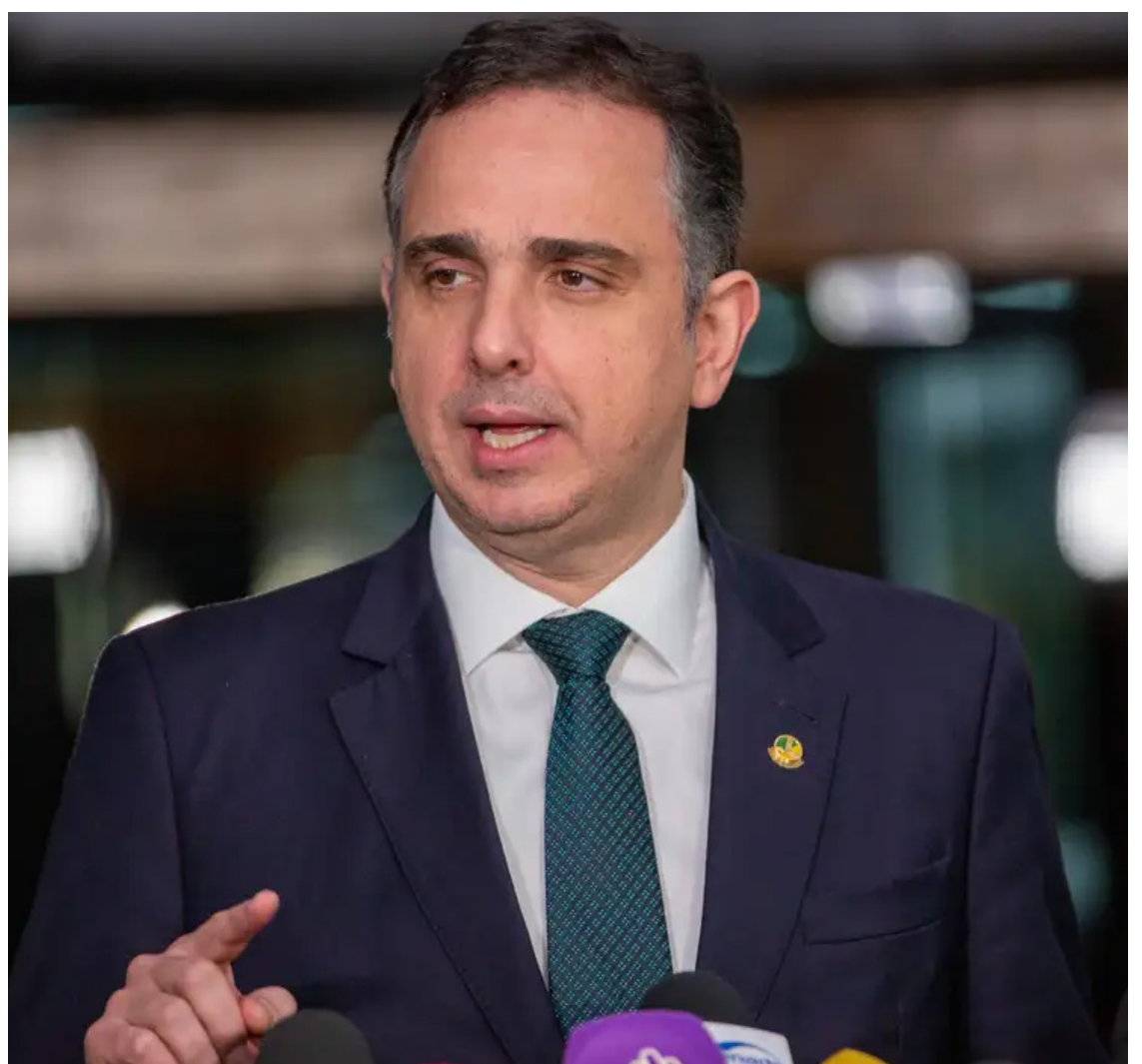
Rodrigo Pacheco (PSD-MG): ampla negociação sobre dívidas dos estados

Padrinho do projeto de renegociação, Pacheco já antecipou que o Ministério da Fazenda aceita a criação do fundo. Mas os estados com dívida querem ter também acesso a esses recursos. É o caso do governador de São Paulo, Tarcsísio de Freitas.