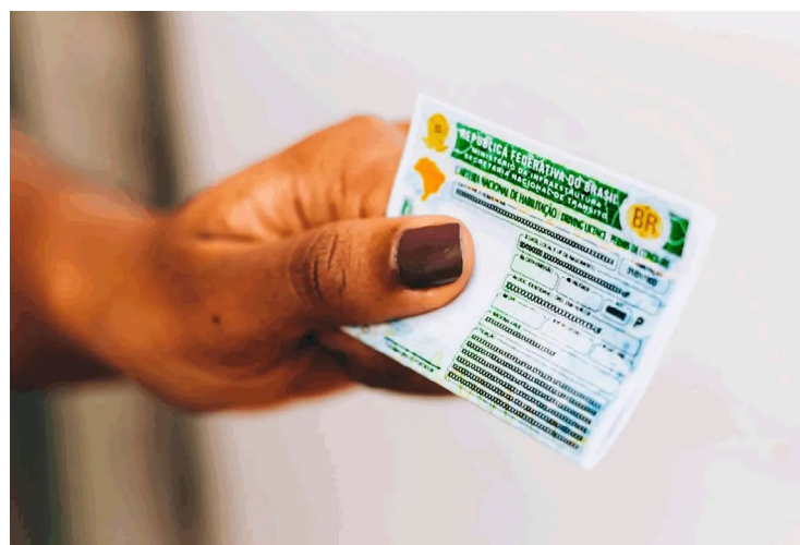
Candidato que estiver com dúvida em relação ao andamento ou validade do processo pode consultar no Portal Expresso ou site do Detran

789/2020 do Contran, o processo de habilitação, adição ou mudança de categoria tem a validade de 12 meses. Porém, devido à pandemia várias deliberações foram sendo publicadas prorrogando os prazos.