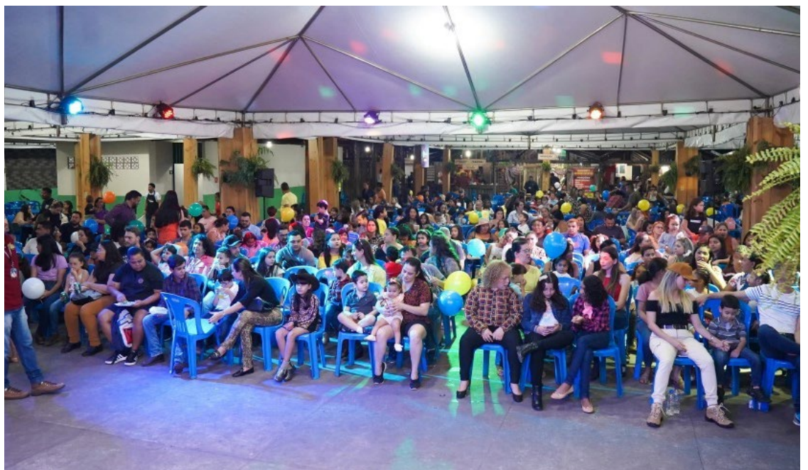
Show infantil na Expo Rio Verde: com entrada gratuita, as apresentações vão acontecer às 18 e 20h30 — Foto: Reprodução.

Além disso, a organização da 64ª Exposição Agropecuária, pontua que nesta edição o parquinho de diversões está de cara nova proporcionando mais segurança nos carrinhos, rodas-gigantes, carrinho bate-bate e em todos os demais.