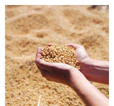
Consórcio de imóveis oferece uma ampla gama de possibilidades para o setor agropecuário

Portanto, diante de um cenário promissor e cheio de oportunidades, o consórcio no setor agropecuário tem um grande potencial de crescimento, ampliando os horizontes e multiplicando as facilidades para produtores e empresários que acreditam no poder do campo.