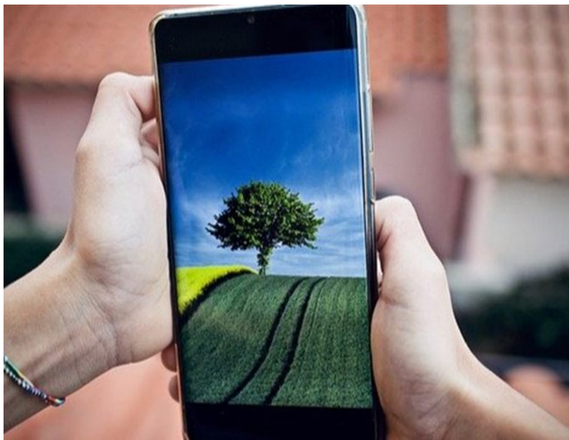
A implementação de estratégias tecnológicas é crucial

A implementação de estratégias tecnológicas é crucial para mitigar os efeitos do aquecimento global e garantir a sustentabilidade empresarial a longo prazo. A Vankka desenvolveu o “Forest Risk Evaluation System for Green Investments”, que utiliza técnicas avançadas de avaliação de riscos e dados específicos do setor florestal para identificar e mitigar riscos como desmatamento, conflitos de terra e eventos climáticos extremos.