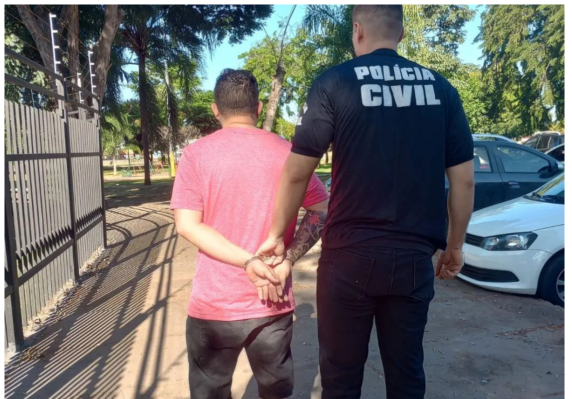
Queda dos índices de feminicídio é resultado do trabalho de integração das forças policiais

A criação da Delegacia Estadual de Atendimento Especializado à Mulher (Deaem) ampliou a atuação das 1ª e 2ª Delegacias Especializadas no Atendimento à Mulher (Deam) de Goiânia e tem como objetivo fortalecer a rede de combate à violência contra a mulher. Existem 26 Deams no estado.