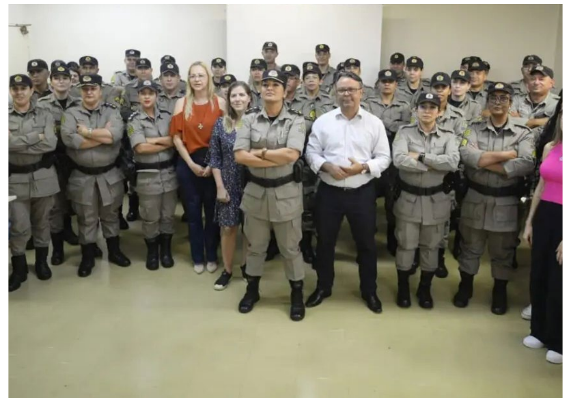
A Patrulha Maria da Penha tornou-se Batalhão da PM em 2020, sendo encarregado do policiamento ostensivo de segurança para atendimento às ocorrências de violência doméstica contra mulheres