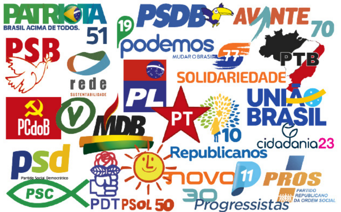
Partidos se preparam para a realização das convenções nos municípios goianos

O prefeito Rogério Cruz, que vai concorrer à reeleição pelo Solidariedade, ainda não definiu a data da convenção, mas acertou composições com oito partidos: Solidariedade, PP, PDT, DC, PMB, Avante e Mobiliza, que integram a sua base de apoio na Câmara Municipal de Goiânia. Há conver-