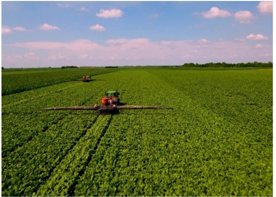
O Mercado de Bioinsumos no Brasil cresce 15% na safra 2023/2024 — Foto: Reprodução.

Eduardo Leão destacou ainda os fatores que impulsionam o crescimento do setor: “Primeiro, profissionalização e expansão da indústria. Há