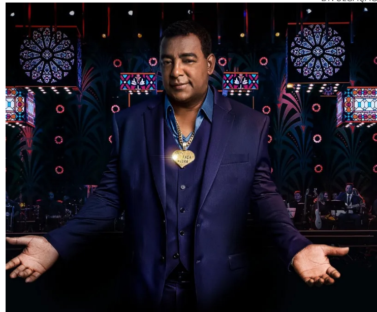
Atração confirmada: Raça Negra se apresenta no domingo, 14