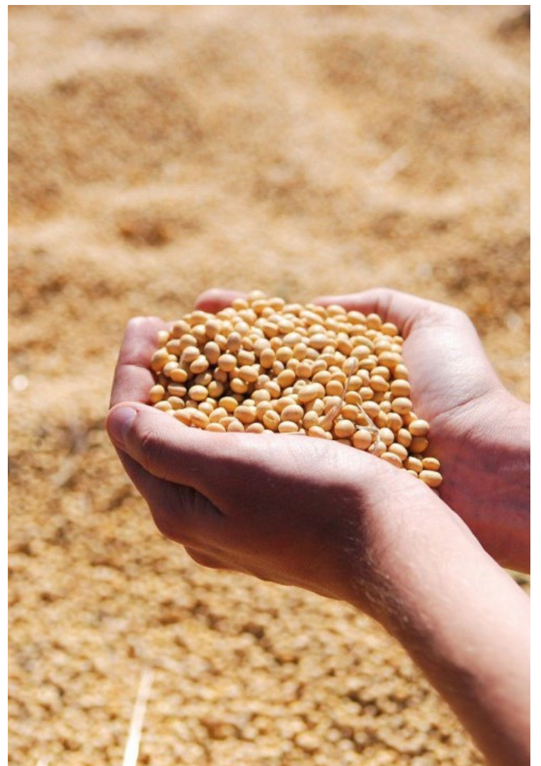
Linhagens de soja em desenvolvimento tem potencial de elevar em 5% a média produtiva nacional

“Registramos um aprimoramento constante das análises que realizamos dos resultados de cada etapa do desenvolvimento de nossas cultivares e das necessidades que surgem com o passar do tempo.