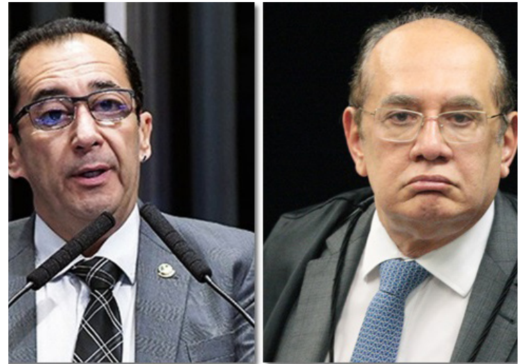
Jorge Kajuru e Gilmar Mendes: conciliação