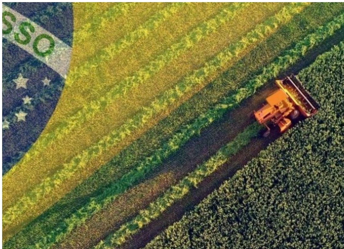
Estudo mostra que o agro brasileiro sustenta superávits da balança comercial brasileira desde 1989 — Foto: Reprodução.

Os dados destacam o alinhamento das exportações agropecuárias brasileiras com os países que representam a maior parte da demanda global. Vários fatores influenciam a busca do mercado internacional pelos produtos agropecuários nacionais, incluindo os diferenciais de preço que refletem a relação entre os preços externos e internos dos bens produzidos pelos agricultores e pecuaristas.